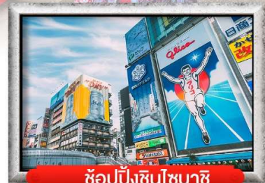
ช้อปปิ้งชินโซบาชิ

เมนู สุดพิเศษ !! บุฟเฟ่ต์ชาบู , หมูย่างไบโอบะ