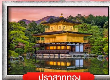
ปราสาททอง